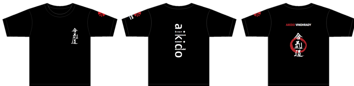
Nová klubová trika. V roce 2012 jsme vytvořili a nechali vyrobit tři grafické návrhy klubových trik.

Nejzajímavější na tomto prolínání je, že aikidisté na tyto akce přinášejí kvality získané na aikidu a obráceně, z těchto seminářů přinášejí novou inspiraci zpět do dojo.